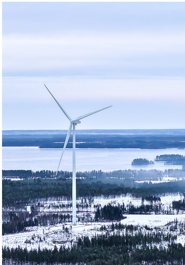
Lestijärvi Wind Farm OX2 / Antti Heikkilä