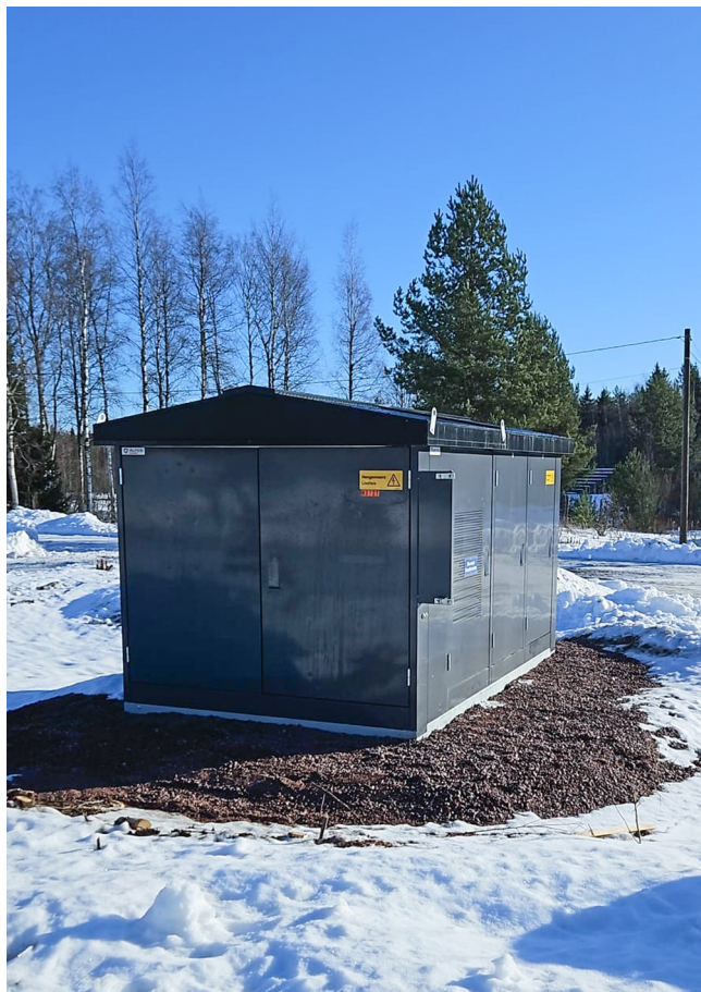
Kuvassa Kymin lentokentälle Jukolan viestin sähkön- tarpeita varten sijoitettu väliaikainen muuntamo.