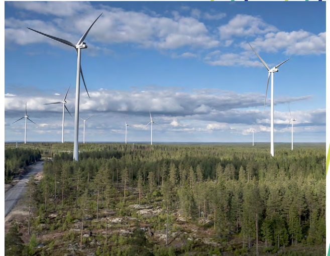
Närpiön tuulivoimapuisto. Lähde: EPV. Kuva: Mikko Havusela.