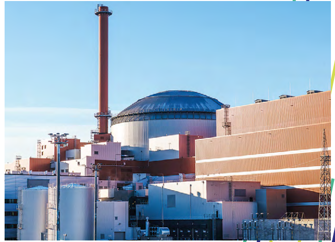
Olkiluoto 3.

Energiakriisin helpottuminen edellisvuodesta näkyi sähkön tukkumarkkinahinnan laskuna. Etenkin loppukevään ja alkukesän aikana hinnat laskivat ajoittain hyvin alas. Hintataso on kuitenkin edelleen selvästi korkeampi kuin ennen kriisin alkua. Jakson keskihinta oli 57,9 €/MWh.